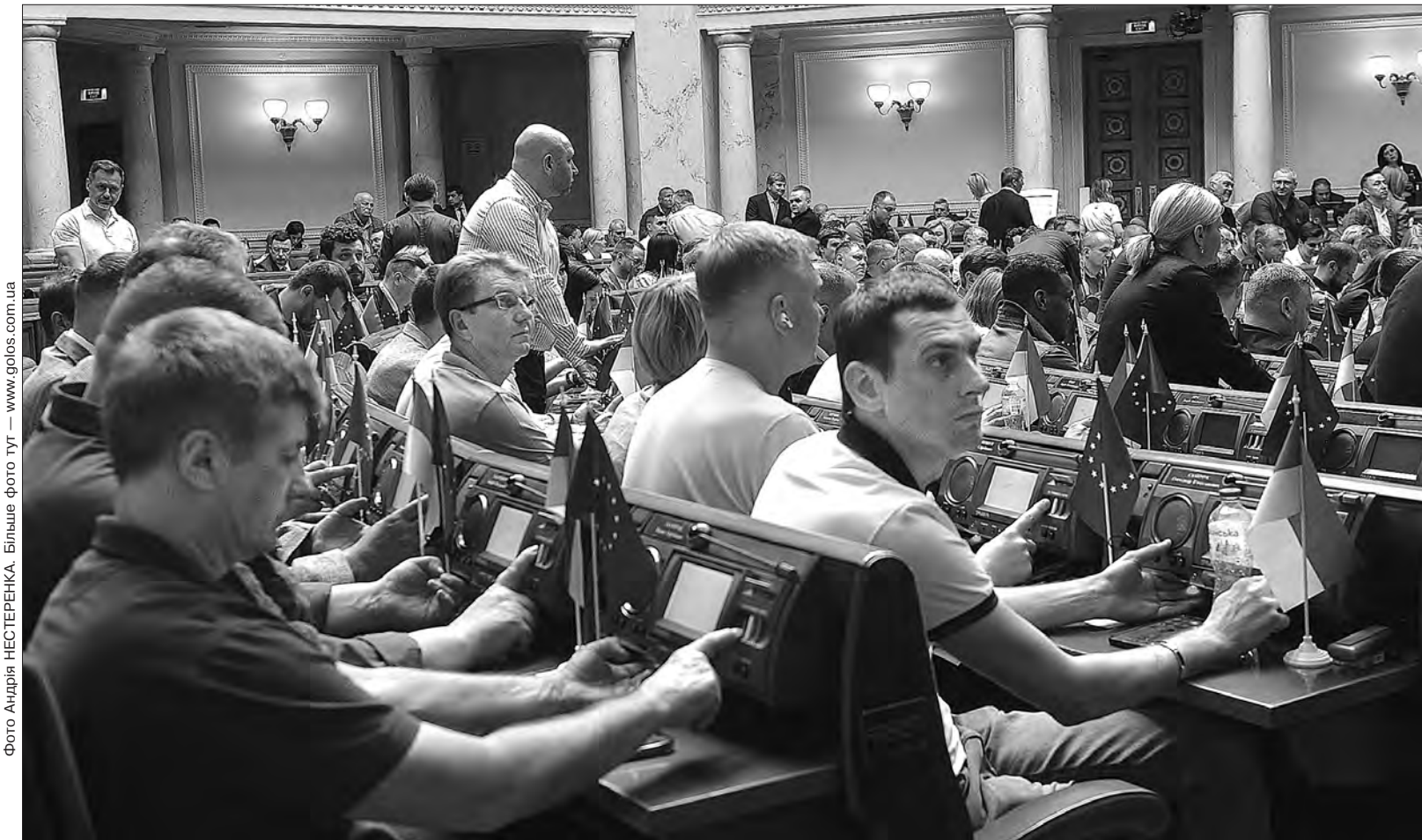
Більше фото тут — www.golos.com.ua