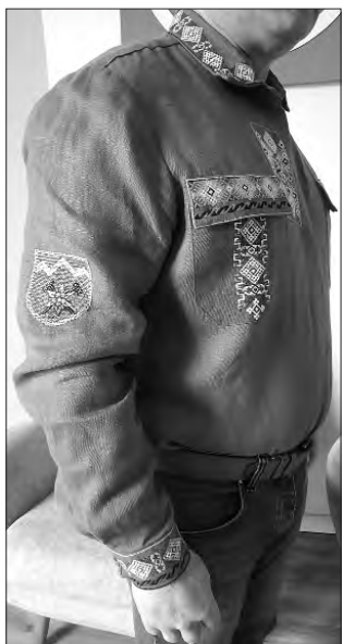
Сорочка для бійців «Едельвейсу».