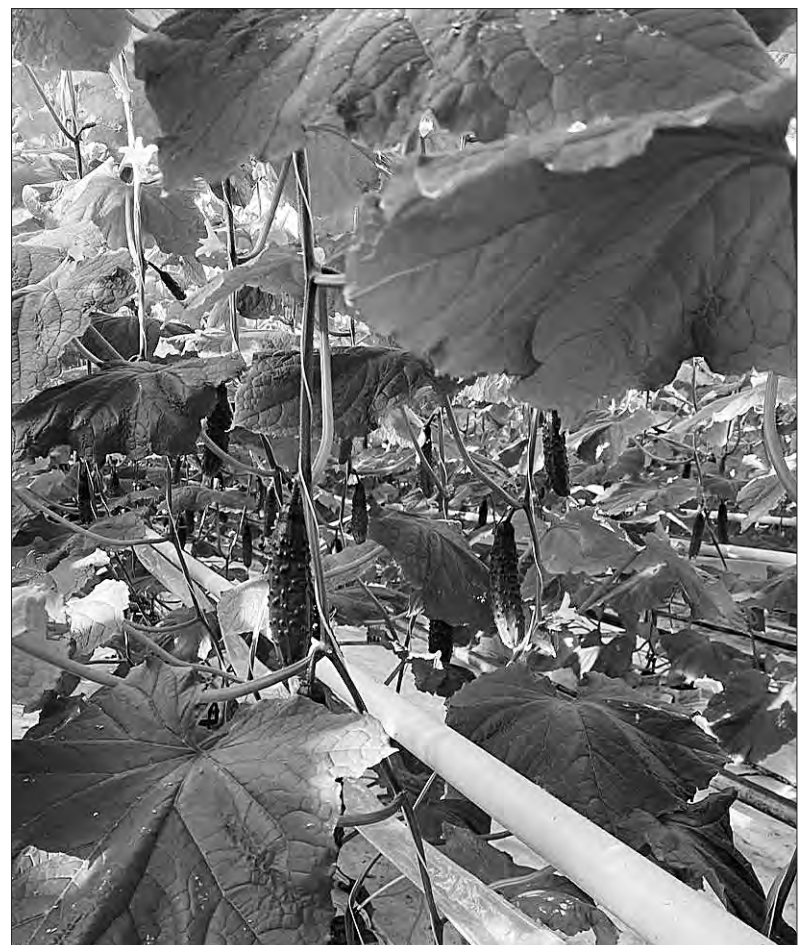
У теплицях «Дніпровського».