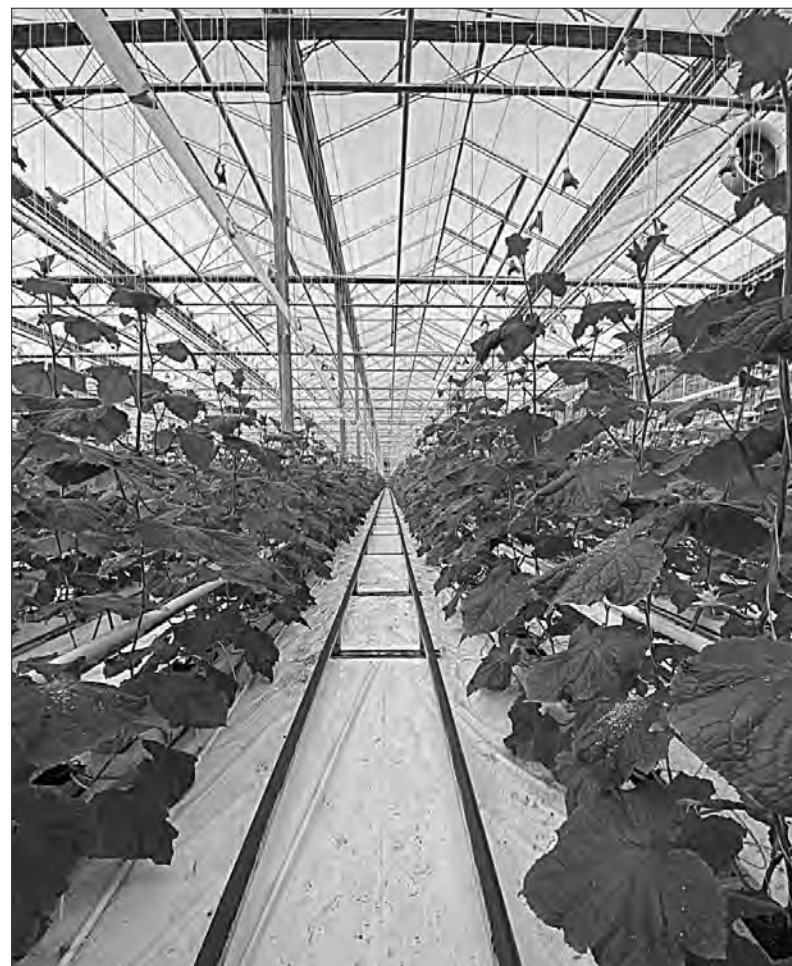
У теплицях «Дніпровського».

«Урядова програма «єРобота» підтримує агровиробників та фермерів. Вони можуть отримати грант на розвиток садівництва, ягідництва та виноградар-